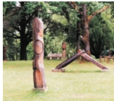
Parque de las Esculturas