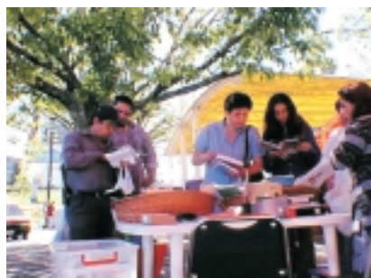
Casero del Libro