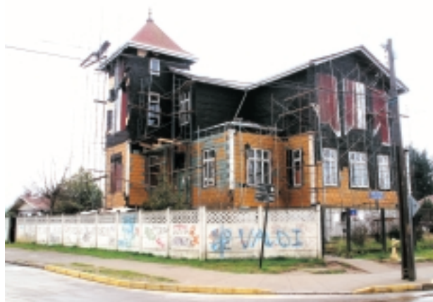
2003 En restauración