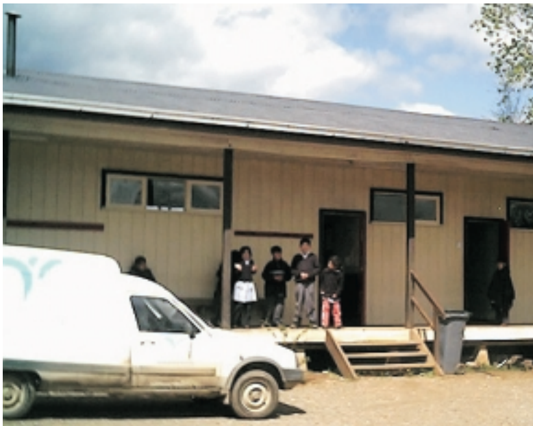
El Bibliomóvil distribuye material Bibliográfico a 15 Escuelas Rurales de la Comuna.

Señala que si este proyecto se hubiera implementado en la ciudad, los resultados habrían sido total mente diferentes, porque los niños del campo se interesan más y aprovechan el beneficio al máximo. "Los niños han aprendido a disfrutar de la lectura, porque no la ven como una actividad impuesta sino como una forma entretenida de adquirir nuevos conocimientos", indica Reinoso.